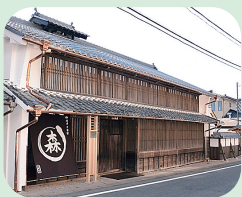
① 大湫宿 (中山道)