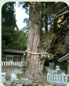
② 神明神社の大杉 (中山道)