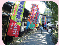
① 美濃歌舞伎博物館「相生座」