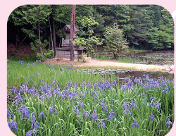
② 弁財天の池（中山道）