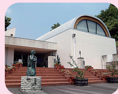
⑤ 市之瀬廣太記念美術館